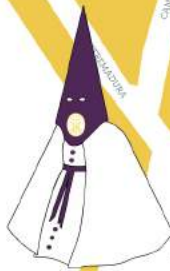
PLAZA DE LA ALAMEDA

"Que el Señor tenga misericordia de nosotros, perdone nuestra falta de amor y servicio y nos lleve a la vida eterna."